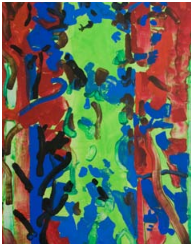
Arvid Hedin Tall Mänty

Varje uppgift ska förverkligas genom åtminstone ett verk. Du kan också lägga särskild vikt vid en uppgift genom att framställa flera verk. Förverklingssätt och redskap kan väljas fritt.